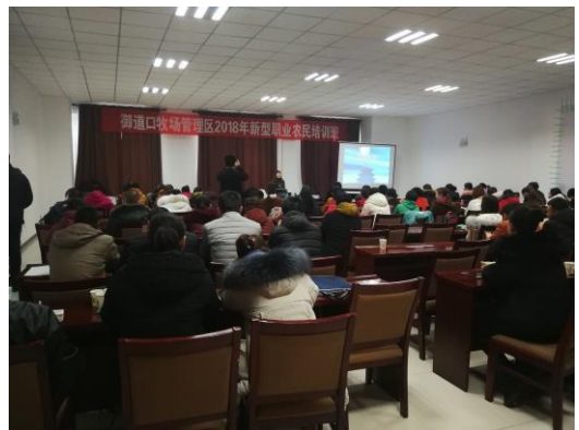
在御道口牧场开展旅游服务与管理培训

围场县旅游资源丰富，旅游产业发展迅速。近年来，我县旅游业发展迅猛，产业规模日益壮大，经济效益逐步提高，已逐步成为我县经济的支柱产业和人民群众满意的现代服务业。农家游作为现代农业和旅游业相结合的一种旅游产业，