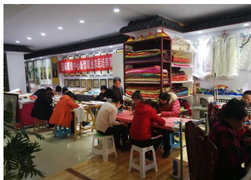
与承德上市满绣公司联合开展满族刺绣培训

围场县具有悠久的历史文化底蕴，可传承可发展的民俗文化非常多，为弘扬和传承历史文化遗产，我校新型职业农民培养办公室积极与承德上世满绣文化开