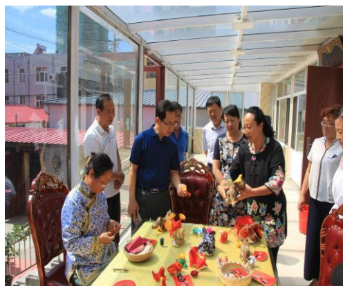
省教育厅安处长视察我校满绣培训

围场县是人口众多的农业大县，旅游资源丰富，具有浓厚的历史文化底蕴。结合县域特点，围场职教中心新型职业农民培养扎实推进技能培训和技能扶贫工作，投入 300 多万元，成立“三农服务中心”，建立了服务基地，配备了专职服务人员和由专业教师及学生组建的服务队伍，为全县农业，农村和农民提供新技术、新技能培训，分别进行了黑木耳种植、满绣、月嫂、果林技术、旅游服务与管理、饮食与健康、电商、种植、养殖、电工、焊工、架子工、家庭教育等技能培训。共开展 32027 人次培训，取得显著效果。在培训工作中，坚持“以教育促产业、以产业促发展”为核心，以“培训一人、成功一户、带动一片、致富一方”为目标，建立健全各项服务机制，完善服务体系。通过集中培训、跟踪技术指导、探索服务路径、积累培训经验、创设管理制度等方法 and 途径，把规范和实效作为开展工作的出发点和落脚点，并结合区域特点精心打造服务体系。培养和造就了一大批适应三农需求的技能型人才，在全县经济的发展和脱贫攻坚工作等方面做出了突出贡献，在省、市、县主管部门多次检查中都获得高度赞扬。