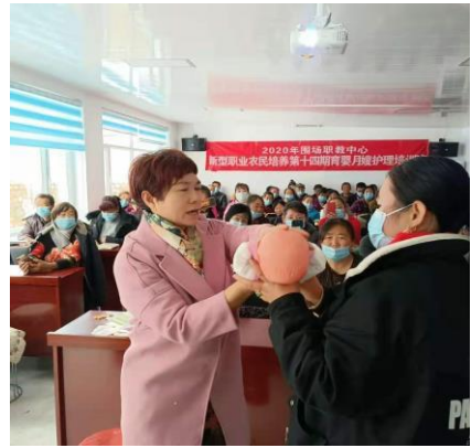
2020年第14期母婴护理技能培训

随着二胎放开，为母婴护理行业提供了一个良好的客户环境，月嫂的市场需求十分巨大，工资也不断升高，月嫂俨然已经成为当代中年女性的热门就业之选。有着很好的就业前景，我校新型职业农民培养外聘专家技师在农民家门口举办培训班，以贫困村留守妇女