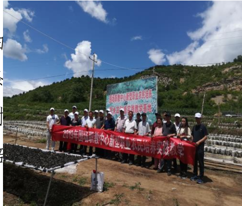
黑木耳实践教学培训

结合气候优势和资源优势，围场县黑木耳产业得到飞速发展，但是由于技术人员匮乏，导致整个产业链条连续多年出现“大小年”现象。针对这一实际问题，我校新型职业农民培